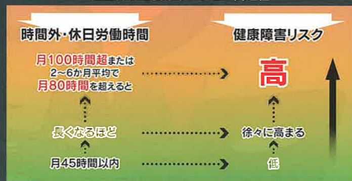
過重労働と健康リスクとの関連性

(右の図は、労災補償に係る脳・心臓疾患の労災認定基準の考え方の基礎となった医学的検討結果を踏まえたものです。)