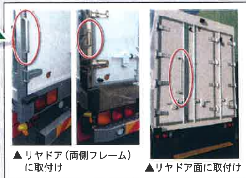
▲ リヤドア（両側フレーム）に取付け

リヤドア面（両端フレーム）にグリップを取り付けて、庫内および庫外に安全に昇降する時のグリップです。対象車種は、小・中・大型クラスで、ボディ形状はバン型、冷蔵冷蔵、ウイングです。